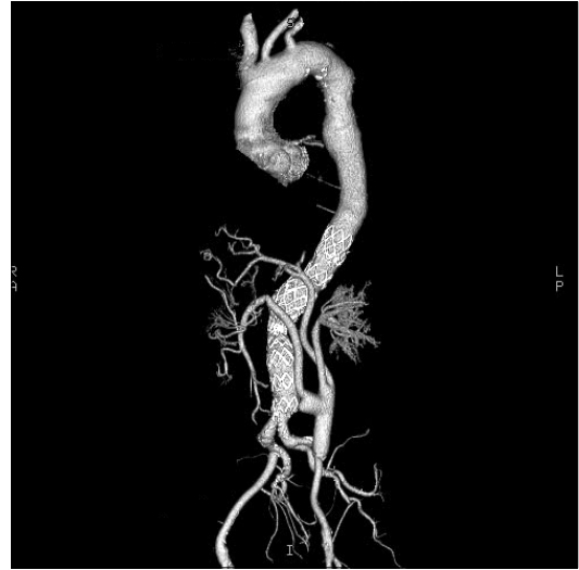
Fig. 4. Post-operative angio CT showing left external iliac artery - both renal arteries, celiac trunk and superior mesenteric artery bypass. Occlusion of right renal artery bypass is showing.

신상부 복부대동맥류의 전통적인 치료법은 개복을 통한 동맥류절제와 인조혈관 대치술이다. 고령, 심한 폐기능부전, 이전에 수술한 경우, 비만 등이 있는 환자들은 이러한 전통적인 수술 후에 사망, 심장합병증, 신장합병증과 신경학적 손상 등의 주요 합병증이 발생될 수 있다. 다양하고 복잡한 흉복부 대동맥류와 신상부복부대동맥류의 치료에 있어서 전통적인 수술을 대신하는 새로운 대안적 치료법으로 하이브리드 수술 방법이 있다. 하이브리드 수술법은 내장혈관과 신동맥을 대동맥과 분리(de-branching) 후 우회수술로 재관류를 시키는 수술법과 혈관내 스텐트 그라프트를 이용하여 대동맥류를 배제하는 시술법을 병