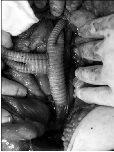
Fig 3. Picture of operation.

mm×길이 130 mm, 상부 36 mm×하부 32 mm×길이 130 mm, 상부 34 mm×하부 28 mm×길이 130 mm였다. 대동맥 혈관촬영을 하여 endo-leak이 없음을 확인 후 수술을 끝냈다. 수술시작 시부터 뇌척수액배액을 하여 압력을 15 mmHg 이하로 유지를 하였다. 뇌척수액 배액관은 3일간 유지 후 제거를 하였다. 수술 3주 후에 촬영한 대동맥 컴퓨터 촬영상 우측 신동맥은 이식혈관 폐쇄가 발생되었으나 나머지 내장혈관과 좌측 신동맥으로는 원활한 혈류의 흐름을 관찰할 수 있었다(Fig. 4). 수술 후 환자는 진전성 망(delirium tremens)과 폐렴으로 치료를 받고 수술 31일 후에 퇴원을 하였다. 현재 퇴원 후 특별한 문제는 없다.