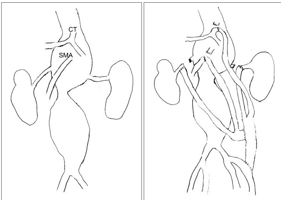
Fig. 2. Schematic drawing of operation (CT=Celiac trunk; SMA=Superior mesenteric artery).

합 연결을 하였다. 복강동맥과 좌측 신동맥을 대동맥으로부터 분리(debranching) 하고는 PTFE 16×8 mm Y graft의 8 mm 부분인 다리부분과 Prolene 6-0으로 봉합 연결을 하였다. 이어 좌측 외장골동맥과 봉합 연결된 PTFE 16×8 mm Y graft의 16 mm 몸체부분을 부분적으로 혈관검자로 잡고 또 다른 PTFE 16×8 mm Y graft의 16 mm 몸체부분과 Prolene 6-0으로 봉합 연결을 하였다. Y graft의 두개의 8 mm 다리부분은 대동맥으로부터 분리된(debranching) 상장