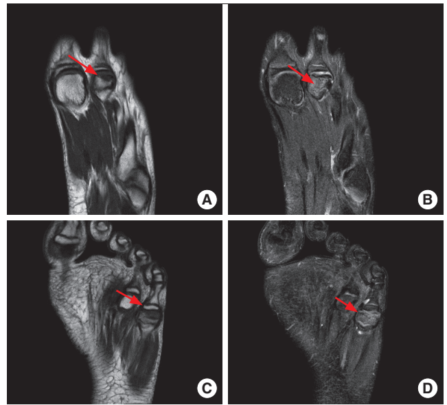
Fig. 2. (A-D) T1 and T2 weighted magnetic resonance imaging of left foot shows loss of sphericity of left 2nd, 5th metatarsal bone due to collapse of bone and sclerotic change (arrow). High signal in T2 fat suppression image suggest subchondral marrow edema in 2nd, 5th metatarsal bone (arrow).

퇴원 후 외래 추적관찰하며 시행한 혈액검사결과에서 빈혈이 지속되어 수혈이 계속 필요하였으므로 수혈에 의한 합병증인 혈철소증을 예방하고, 철킬레이트화 약제 사용을 줄이기 위해 7세에 비장