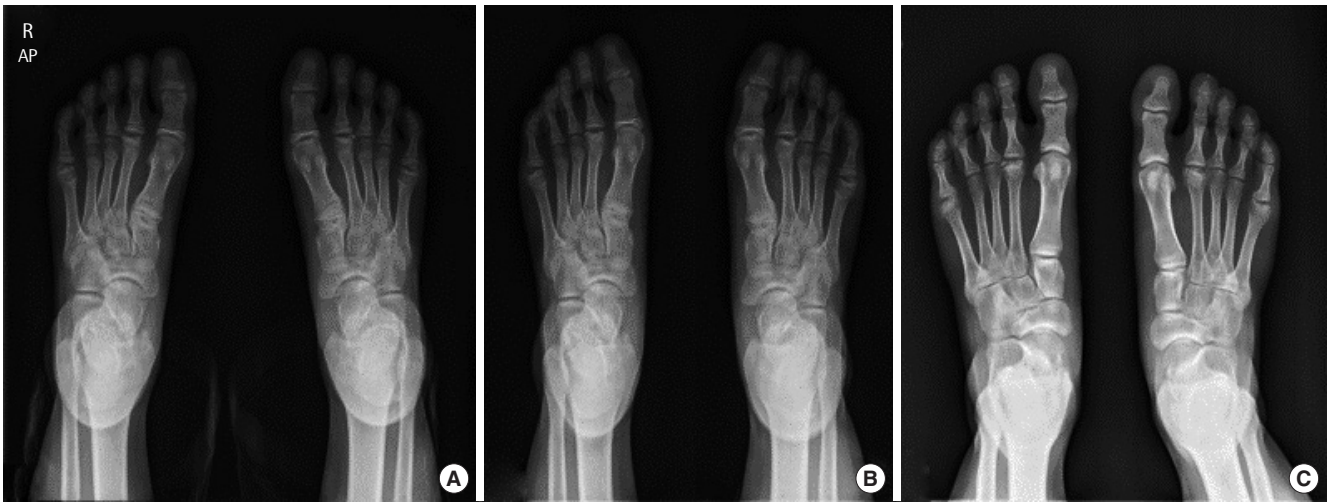
Fig. 3. (A) Collapse and fragmentation of 2nd and fifth metatarsal bone head. (B, C) Mild radiographic changes after 2 and 3 years. Gradual regeneration of epiphysis except large fragmented bone of 2nd metatarsal bone. AP, anteroposterior.